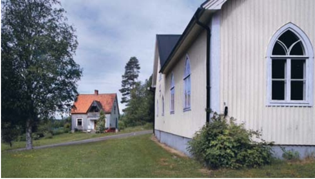
Per Olov Enquist bodde intill 13 års ålder i Östra Hjuggböle i det blekgröna huset. I förgrunden det gula bönhuset som är skildrat i flera av Enquists verk.