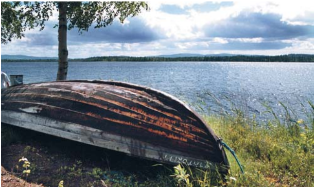
Helmer Grundström, Lappmarkens förste och mest betydande diktare, växte upp i Svanavattnet.