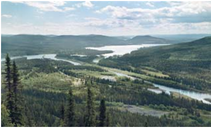
Linnea Fjällstedt har skrivit om det strävsamma livet i fjällområdena kring Saxnäs.