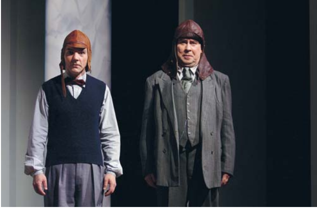
Från Västerbottensteaterns uppsättning av Pölsan 2004.