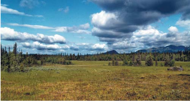
Elisabeth Rynells roman Hobaj utspelar sig i lågfjällsområdet Stöttingfjället.